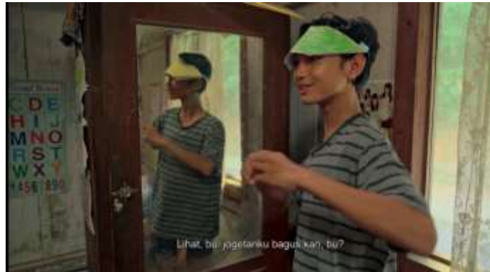
Foto-Foto Dalam Adegan Film Benalu